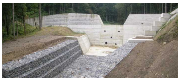
土石流発生前 (H25.10月撮影)

平成28年8月23日、空沢川で土石流が発生した。平成25年に完成した堰堤が土石流を捕捉し、下流の集落への被害を軽減した。