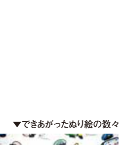
▼できあがったぬり絵の数々