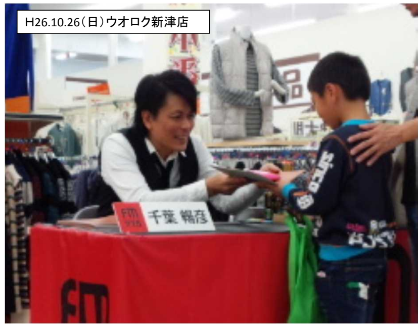
H26.10.26(日)ウオロク新津店